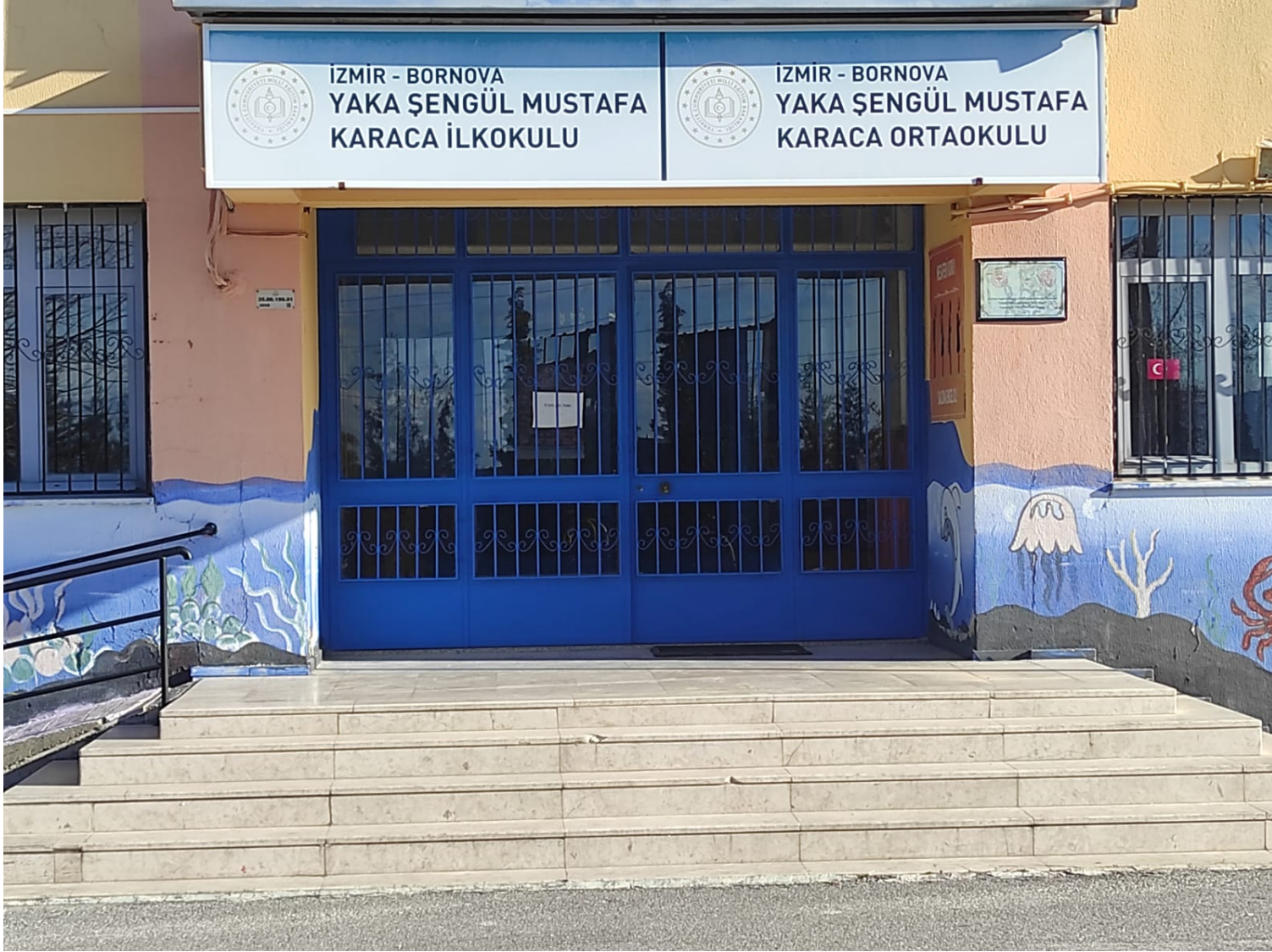
YAKA ŞENGÜL MUSTAFA KARACA İLKOKULU/ORTAOKULU